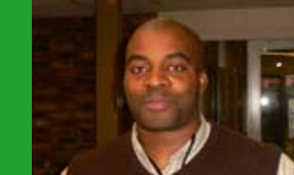
Rencontre avec le directeur de l'APV