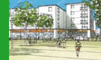
des réalisations concrètes