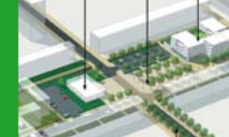
Une vision d'ensemble...